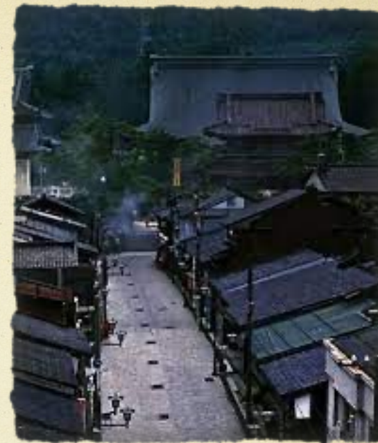
Centre ville historique d'Inami

La conception du symbole variera selon le sculpteur.