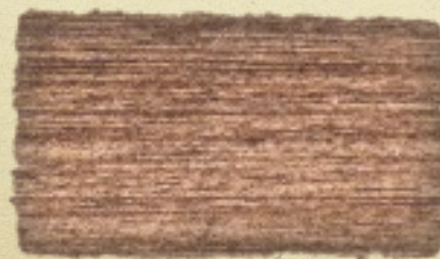
PC Triple C